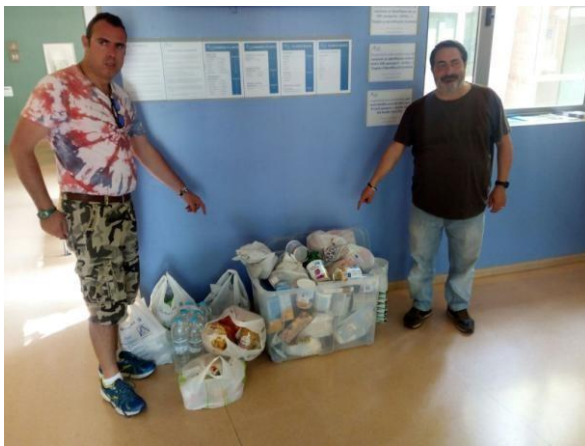
Donativo puntual de usuarios del ambulatorio de CamBou de Castelldefels