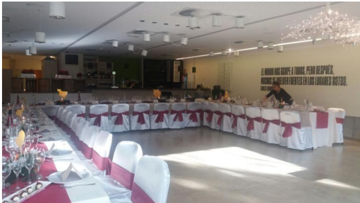
Evento festivo desde el Restaurant Solidari