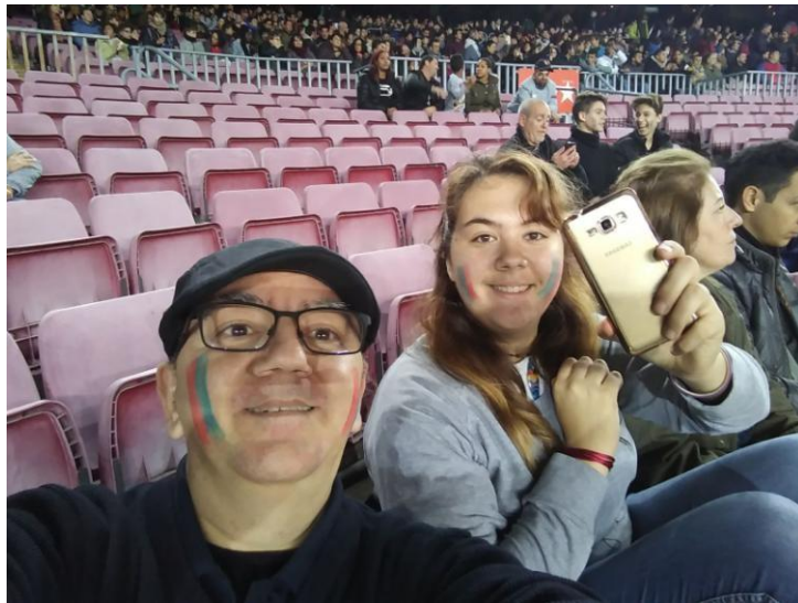
Regalo del Cub Deportivo Barça de entradas para los voluntarios de Imperfect