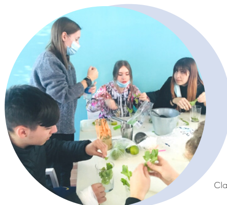
Classe de còctels per als alumnes del PTT.