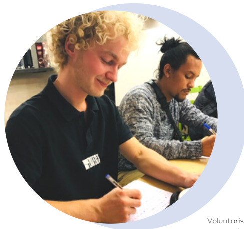
Voluntaris en una activitat nadalenca on van escriure cartes als clients i els clients als voluntaris.