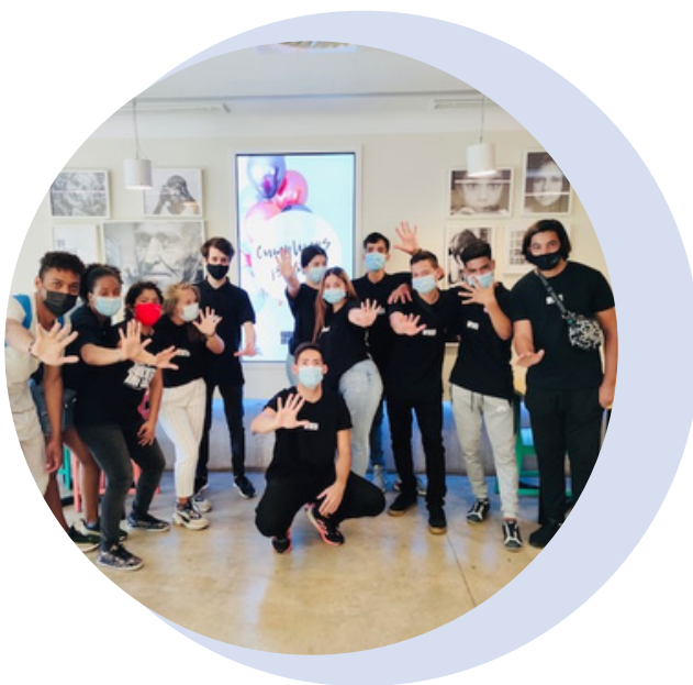
Equip de voluntaris a la setmana de celebració dels nostres 5 anys.

Estem molt agraïts per cada persona involucrada, cada voluntari, cada entitat col·laboradora, per les entitats públiques que van col·laborar a través de subvencions i per cada client que va venir a menjar cada dia i que va difondre el projecte per a ajudar a centenars de persones de la nostra ciutat.