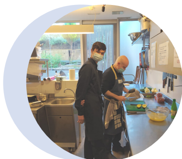
Classe de cuina.

El nostre desig és servir sempre a la nostra ciutat i encara ens queda aprendre a que convivan ambos programas de la manera más eficaz y efectiva posible. ¡Ho aconseguirem!