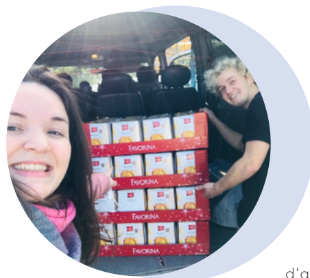
Repartiment d'aliments i cistelles de Nadal.