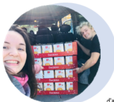
Repartiment d'aliments i cistelle