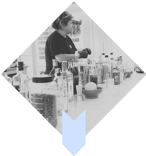
Taller de formació en cocteleria