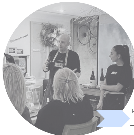
Professor del PFI amb una de les alumnes durant el Tast de Vins que es va oferir a empresaris de Castelldefels