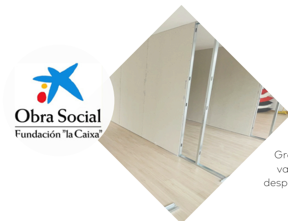
Gràcies a la subvenció de la Caixa vam poder ampliar el nombre de despatxos d'atenció social i millorar la nostra infraestructura.