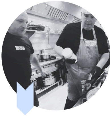
Formació, la clau en el nostre acompanyament (Taller de rebosteria)

Les persones venen al projecte Imperfect buscant bàsicament, eines per a tenir una sortida laboral. I podem dir, sense cap dubte, que tots els que porten aquest desig (un 90%) troben un treball que els permet viure de manera digna.